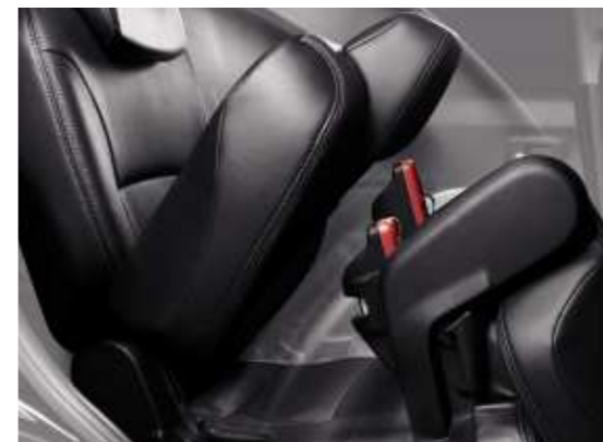
Los asientos traseros son deslizantes, inclinables y replegables.