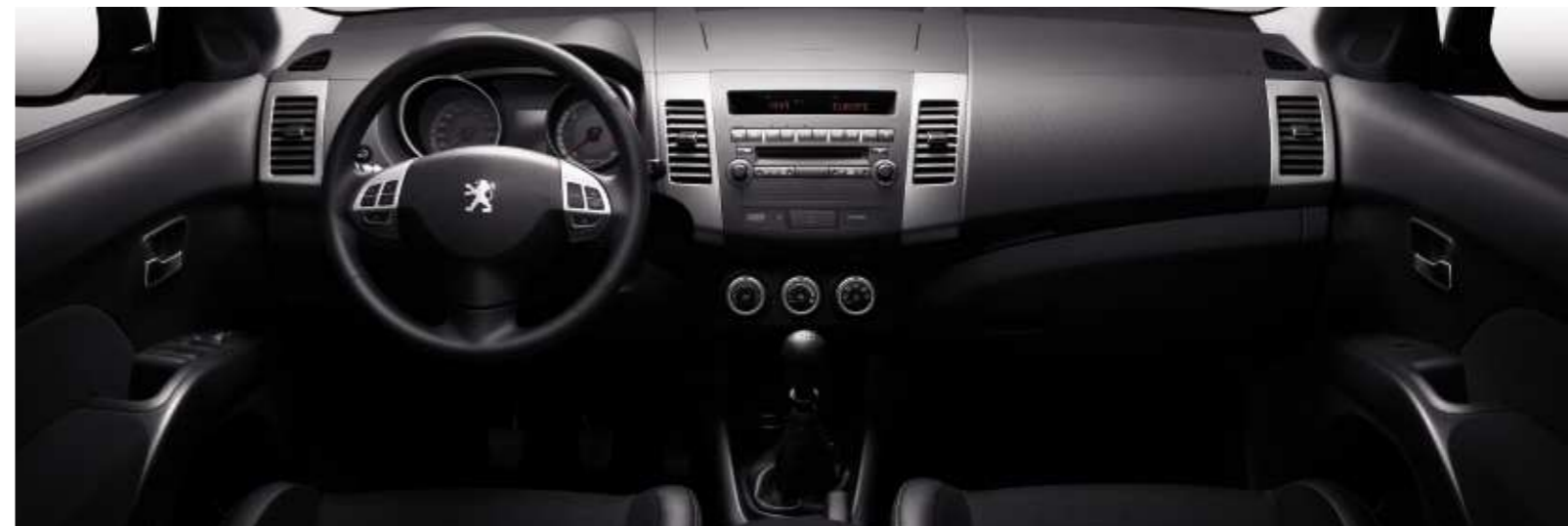
Interior Nivel Premium