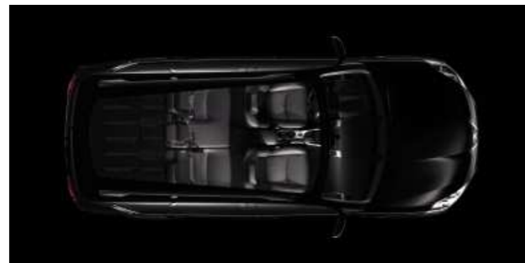
Configuración 5 plazas

También podrá acoger pasajeros adicionales y viajar 7 personas, gracias al asiento continuo ocultable situado dentro del piso del maletero.