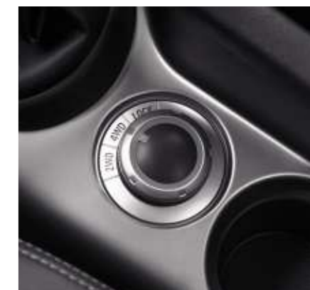
Mando manual del modo de transmisión.

Nieve, arena, barro, condiciones más complicadas, pase a modo bloqueo (4WD LOCK): el sistema envía entonces hasta 1,5 veces más par a las ruedas traseras que en modo automático y le ayuda a salvar la dificultad a baja velocidad.