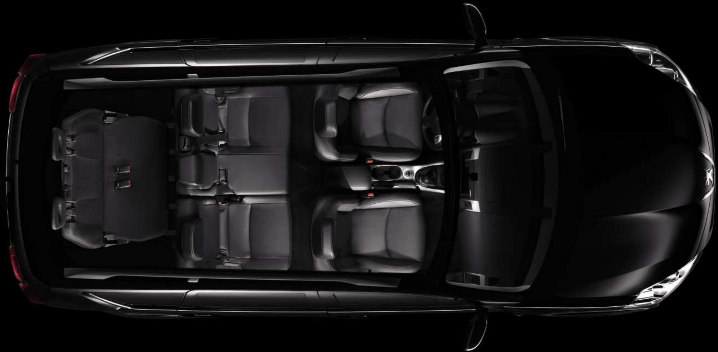
Configuración 7 plazas