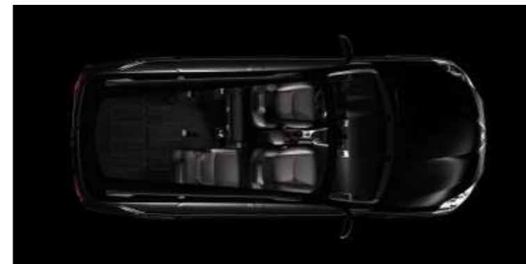
Configuración 3 plazas