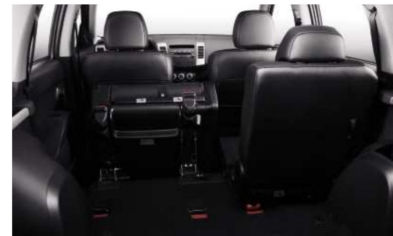
2ª Fila de asientos repliegable

Para transportar numerosos equipajes o todo el material necesario para una lejana expedición, los asientos traseros, modulables, se fraccionan en la proporción 2/3 – 1/3, se deslizan 80 mm a lo largo y disponen de respaldo inclinable. El maletero alberga un asiento continuo ocultable en el piso, capaz de acoger dos pasajeros más.