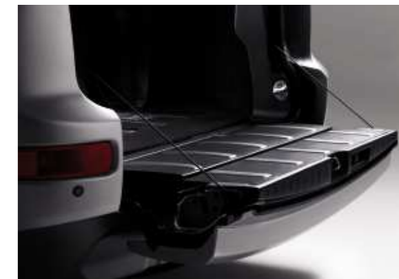
El portón trasero inferior garantiza una destacada accesibilidad.