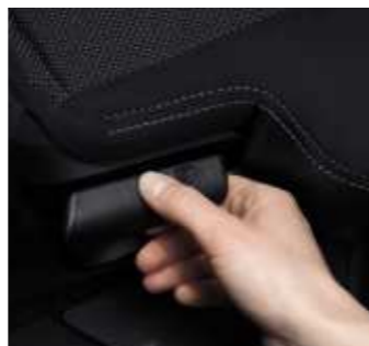
Una lengüeta gobierna el manejo del asiento trasero.

Tras la segunda fila de asientos, el maletero proporciona un extraordinario volumen. Recubierto totalmente por una moqueta queda cerrado mediante un cubre equipajes. Con los asientos plegados, la capacidad de carga del 4007 alcanza 1.686 litros/VDA.